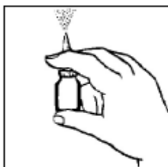
Slika Figure 1

Če pršila niste uporabljali 14 dni ali več, ga morate znova »pripraviti« za uporabo. V tem primeru na pršilnik pritisnite 2-krat, dokler iz njega ne začne pršiti fina meglica.